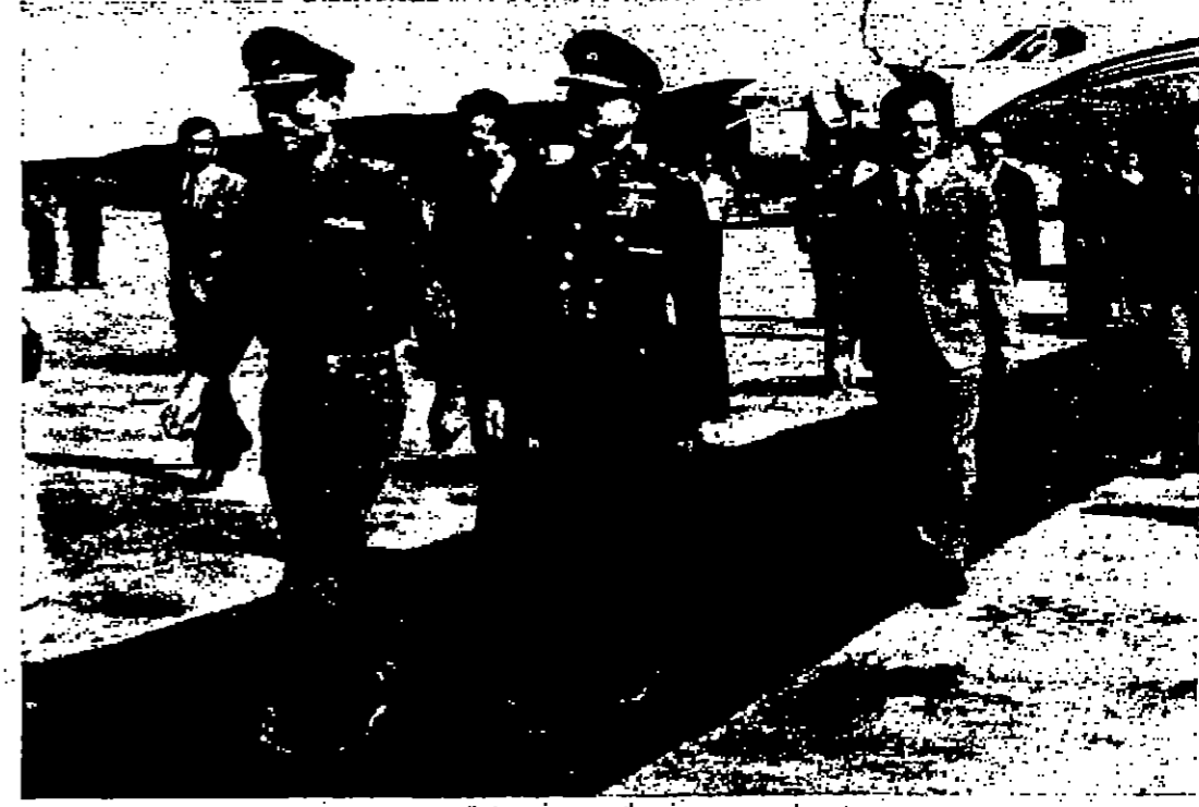
جلالة الحسين لدى وصوله المطار عمان - وفي الصورة سمو الامير محمد وسو الامير حسن ولي العهد ورئيس هيئة اركان الجيش

الثلاثاء في ٢٥ محرم سنة ١٣٨٨ هـ الموافق ٢٣ نيسان سنة ١٩٦٨ م رقم العدد ٢٧٢ AD-DUSTOUR - ARABIC DAILY NEWSPAPER AMMAN TUESDAY 23-4-1968 No. 372